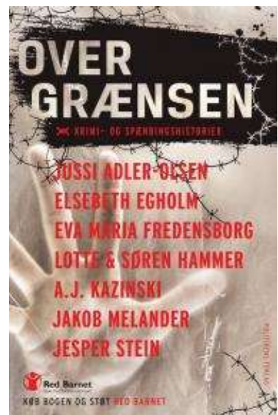
(/boeger/over-graensen-krimi-og-spaendingshistorier) OVER GRÆNSEN, KRIMI-OG SPÆNDINGSHISTORIER (/BOEGER/OVER-GRAENSEN-KRIMI-OG-SPAENDINGSHISTORIER) Af diverse forfattere