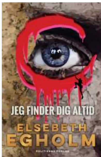
(/boeger/jeg-finder-dig-altid) JEG FINDER DIG ALTID (/BOEGER/JEG-FINDER-DIG-ALTID) Af Elsebeth Egholm