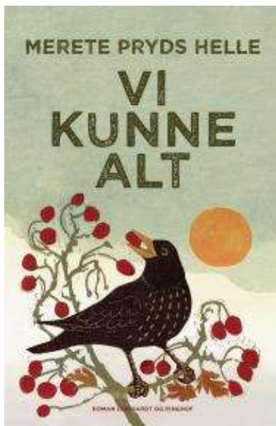
(/boeger/vi-kunne-alt) VI KUNNE ALT (/BOEGER/VI-KUNNE-ALT) Af Merete Pryds Helle