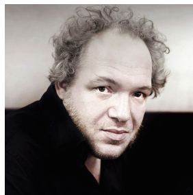
Forfatterportræt fra bogen