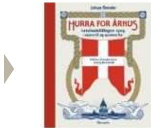
HURRA FOR ÅRHUS - LANDSUDSTILLINGEN 1909

( http://www.historie-online.dk/boger/hurra-for-aarhus-