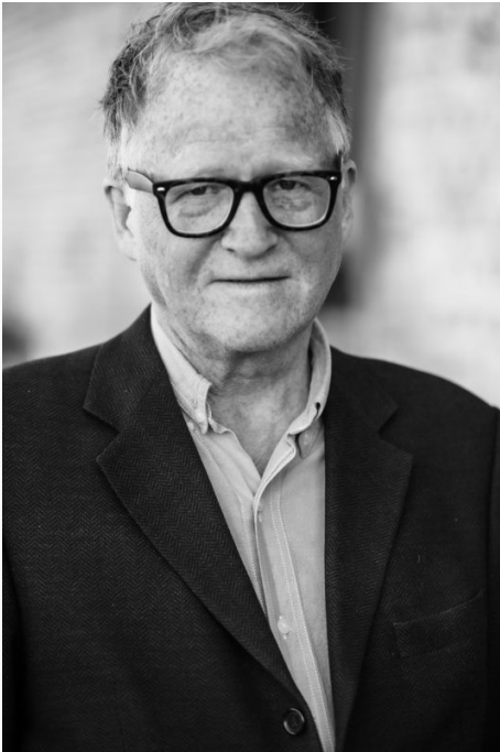
Thomas Ubbesen i dag.