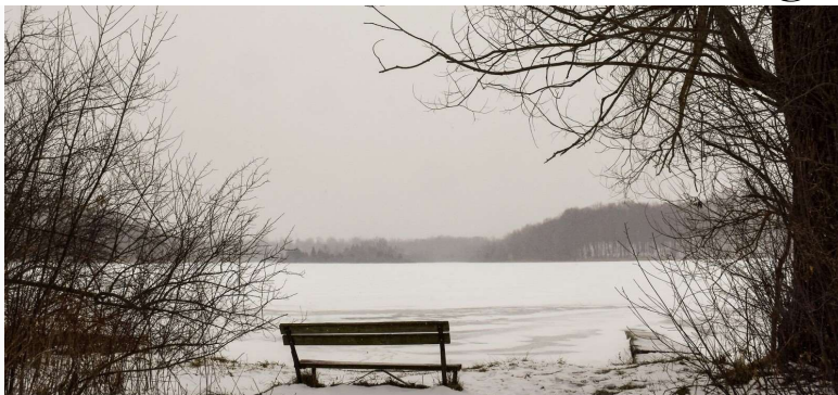
Isdækket sø.