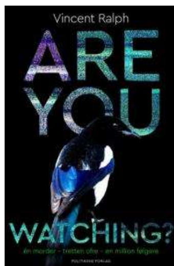
(/boeger/are-you-watching) ARE YOU WATCHING? (/BOEGER/ARE-YOU-WATCHING) Af Vincent Ralph (