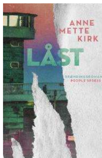
(/boeger/laast-spaendingsroman) LÅST (/BOEGER/LAAST-SPAENDINGSROMAN) Af Anne Mette Kirk