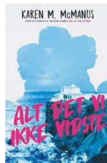
(/boeger/alt-det-vi-ikke-vidste) ALT DET VI IKKE VIDSTE (/BOEGER/ALT-DET-VI-IKKE-VIDSTE) Af Karen M. McManus