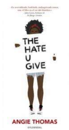
(/boeger/hate-u-give) THE HATE U GIVE (/BOEGER/HATE-U-GIVE) Af Angie Thomas