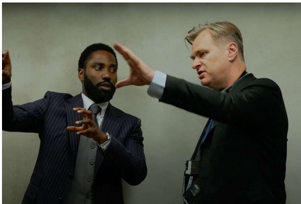
Protagonisten spillet af John David Washington (venstre) og instruktør Christopher Nolan (højre).

Men selv gennem mit indre 18-årige hashrygermindset ledte jeg forgæves. Efter cirka halvanden times tid skrottede jeg mindsettet. Det nyttede ikke noget; der var ikke en interessant pointe.