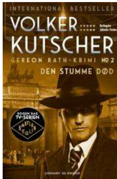
(/boeger/den-stumme-dod-no-2) DEN STUMME DØD NO 2 (/BOEGER/DEN-STUMME-DOD-NO-2) Af Volker Kutscher