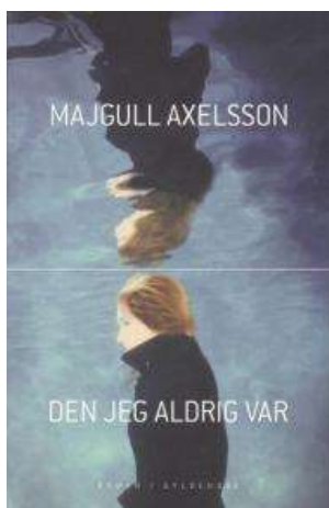
(/boeger/den-jeg-aldrig-var) DEN JEG ALDRIG VAR (/BOEGER/DEN-JEG-ALDRIG-VAR) Af Majgull Axelsson