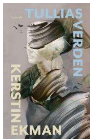
(/boeger/tullias-verden) TULLIAS VERDEN (/BOEGER/TULLIAS-VERDEN) Af Kerstin Ekman