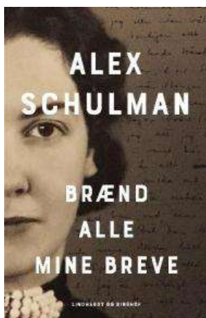
(/boeger/braend-alle-mine-breve) BRÆND ALLE MINE BREVE (/BOEGER/BRAEND-ALLE-MINE-BREVE) Af Alex Schulman