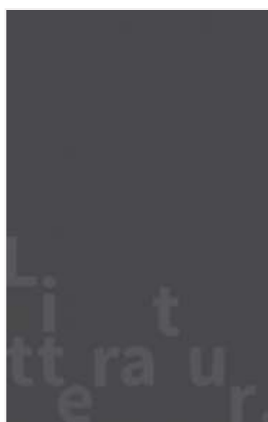
(/boeger/aprilheksen) APRILHEXEN (/BOEGER/APRILHEXEN) Af Majgull Axelsson