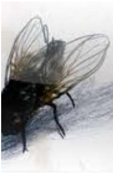
(/boeger/begravelsen-1) BEGRAVELSEN (/BOEGER/BEGRAVELSEN-1) Af Liv Mørk