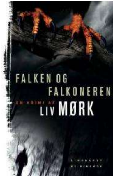
(/boeger/falken-og-falkoneren) FALKEN OG FALKONEREN (/BOEGER/FALKEN-OG-FALKONEREN) Af Liv Mørk