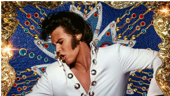
Austin Butler som Elvis Presley, pressefoto