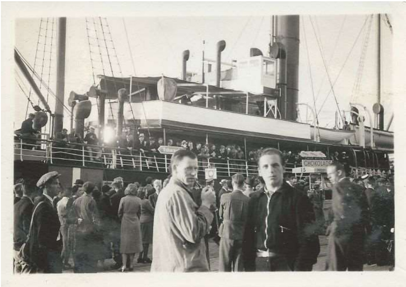
Danske arbejdere afrejser i sommeren 1940 med skibet Cimbrja fra Larsens Plads i København til marineværftet i Kiel. Et tysk orkester spillede ved afrejsen. FHM.