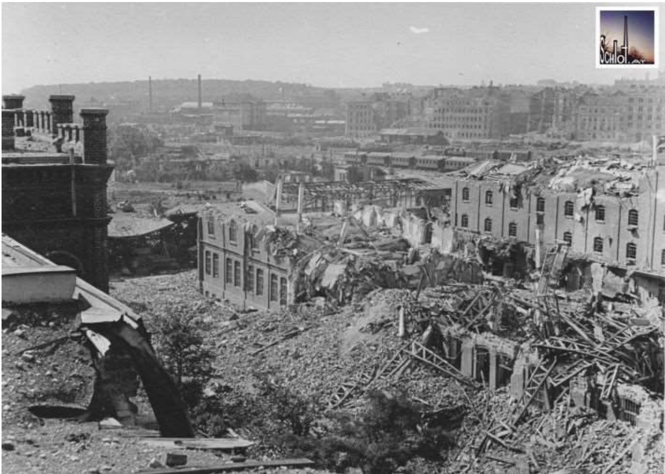
Wien blev udsat for voldsomme luftbombardementer under krigen