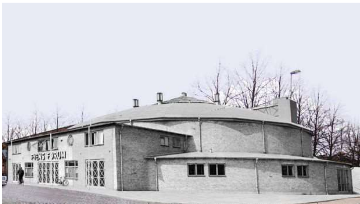
Fyns Forum i Odense hvor Det tyske Arbejdsanvisningskontor holdt til