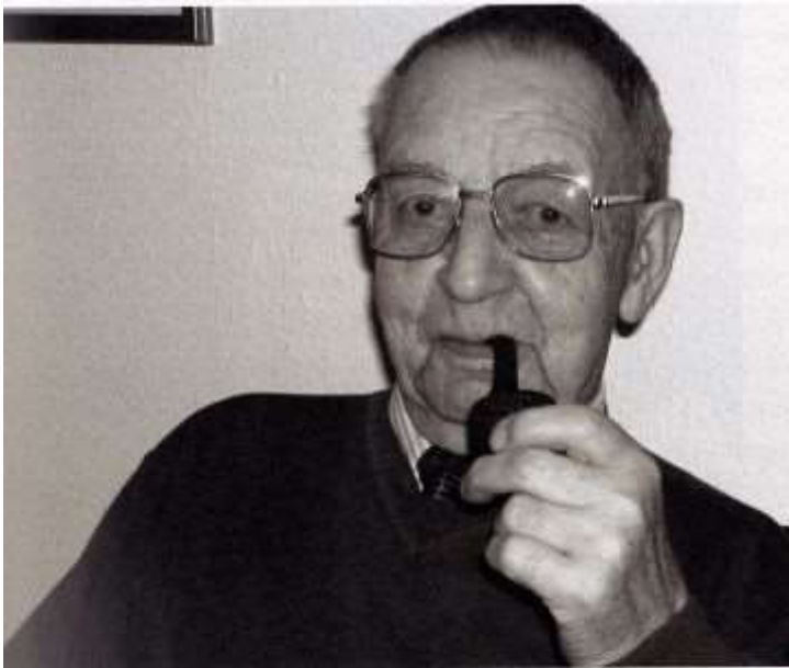
Min far kort før han døde i 2009