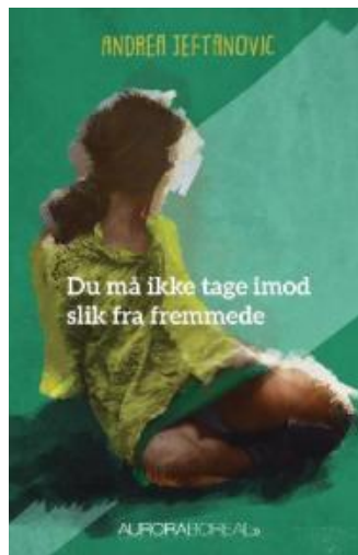
(/boeger/du-ma-ikke-tage-imod-slik-fra-fremmede) DU MÅ IKKE TAGE IMOD SLIK FRA FREMMEDE (/BOEGER/DU-MA-IKKE-TAGE-IMOD-SLIK-FRA-FREMMEDE) Af Andrea Jeftanovic (f. 1970)