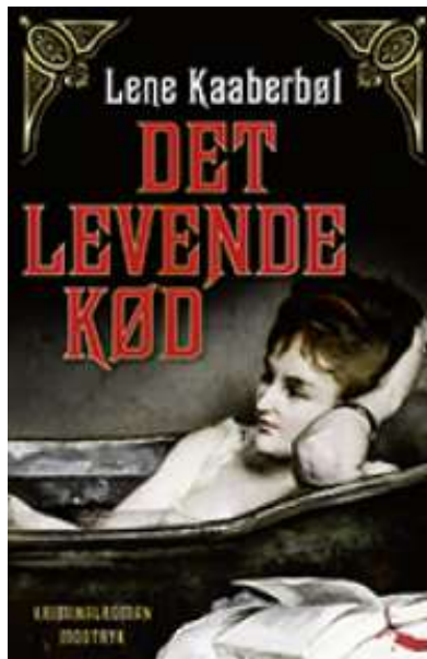
(/boeger/det-levende-kod) DET LEVENDE KØD (/BOEGER/DET-LEVENDE-KOD) Af Lene Kaaberbøl