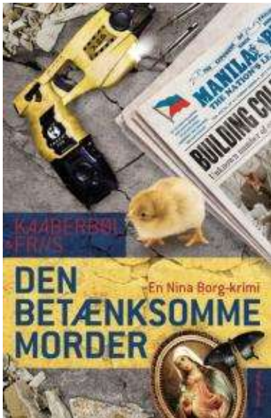
(/boeger/den-betaenksomme-morder) DEN BETÆNKSOMME MORDER (/BOEGER/DEN- BETAENKSOMME-MORDER) Af Lene Kaaberbøl