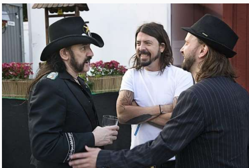
Foto fra bogen, fra venstre Lemmy Kilmister, Dave Grohl og Tim Christensen

Jeg er sikker på, at det ville blive taget godt imod. Ikke fordi de mange, der er kommet på festivalen i 25 år eller mere, er nostalgiske, men fordi de ved, at der rent faktisk er masser fra den rutinerede generation af musikere, der stadig har masser på sinde, og et nyt publikum, de meget gerne vil vinde.