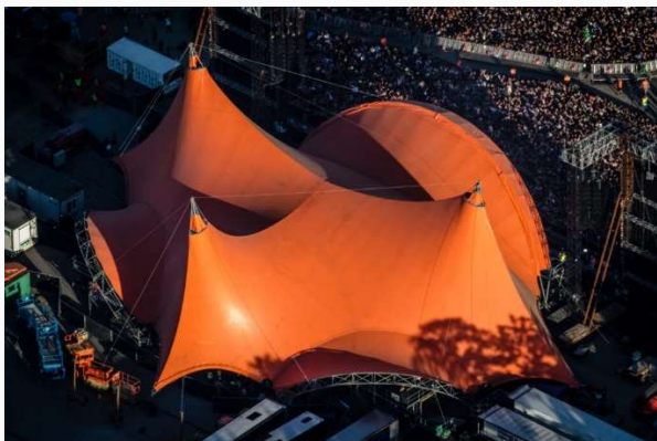
Roskilde Festival: Foto fra bogen –

Det bliver alt sammen slået fast i en let læselig bog, der på underholdende og ligefrem facon bringer os tættere på følelsen af Orange, både når man står der som åbningsnavn, og når man 'bare' har en spilletid der. Bogen udspringer af podcasten ' Orange Scene ' på 24syv. Og teksterne er redigerede udgaver af interviews bragt i samme podcast.