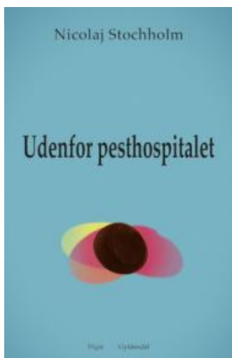
(/boeger/udenfor-pesthospitalet) UDENFOR PESTHOSPITALET (/BOEGER/UDENFOR-PESTHOSPITALET) Af Nicolaj Stochholm