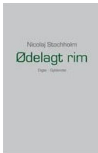
(/boeger/odelagt-rim) ØDELAGT RIM (/BOEGER/ODELAGT-RIM) Af Nicolaj Stochholm