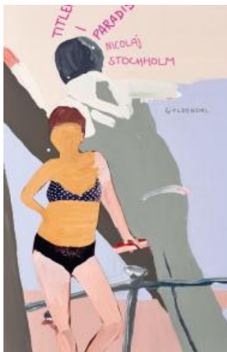
(/boeger/titlen-i-paradis) TITLEN I PARADIS (/BOEGER/TITLEN-I-PARADIS) Af Nicolaj Stochholm