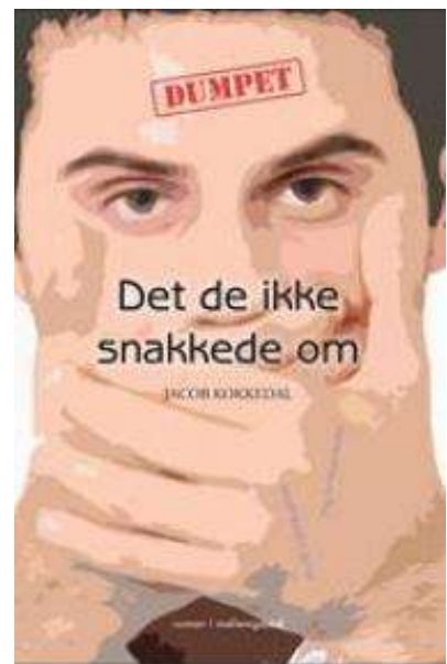
(/boeger/det-de-ikke-snakke-de-om) DET DE IKKE SNAKKEDE OM (/BOEGER/DET-DE-IKKE-SNAKKEDE-OM) Af Jacob Kokkedal