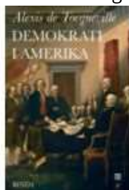
DEMOKRATI I AMERIKA

( http://www.historie-online.dk/boger/anmeldelser-5-5/usa-nord-og-sydamerika/helve-de-og-andre-destinationer )