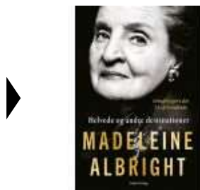
HELVE OG ANDRE DESTINATIONER

( http://www.historie-online.dk/boger/anmeldelser-5-5/usa-nord-og-sydamerika/helve-de-og-andre-destinationer )