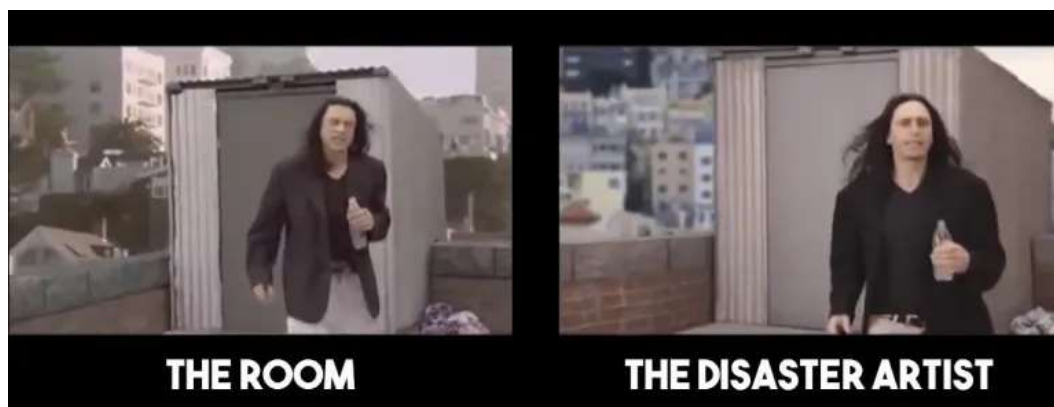
Fig. 5: James Franco formår at imitere Tommy Wiseau næsten til perfektion, men hvad vil han ud over det?

Det er blevet sagt, at der bør være en nødvendighed bag et kunstværk, før det er vedkommende. I så fald må den nødvendighed, som har motiveret James Franco være ønsket om at vise andre fans af The Room , hvor dygtig han selv er til at imitere Wiseau og retorisk spørge: "Er det godt nok?" (fig. 5).