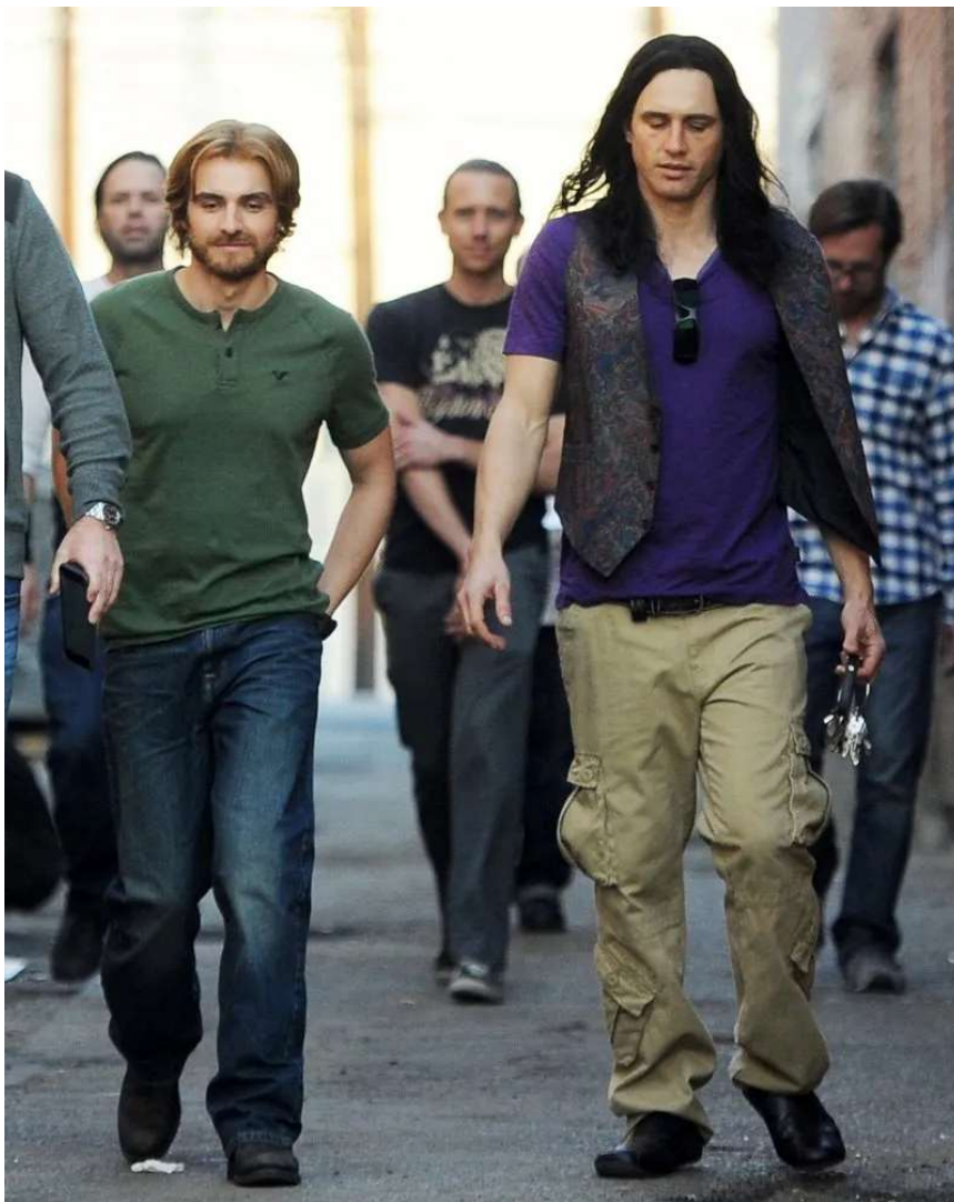
Fig. 4: Dave og James Franco som henholdsvis Greg Sestero og Tommy Wiseau.

Et af The Disaster Artists grundmotiver er venskabet mellem den unge novice og hans ældre, prøvede vejleder, her i en form, der ligner en nutidig udgave af forholdet mellem Don Quixote og Sancho Panza. Wiseau fremstår som fantasen, som er i konstant strid med en omverden, der ser ham som totalt talentløs og uden erkendelse af egne mangler, og Sestero er den loyale væbner, som står ved hans side og trækkes med i virkeliggørelsen af luftkastellerne.