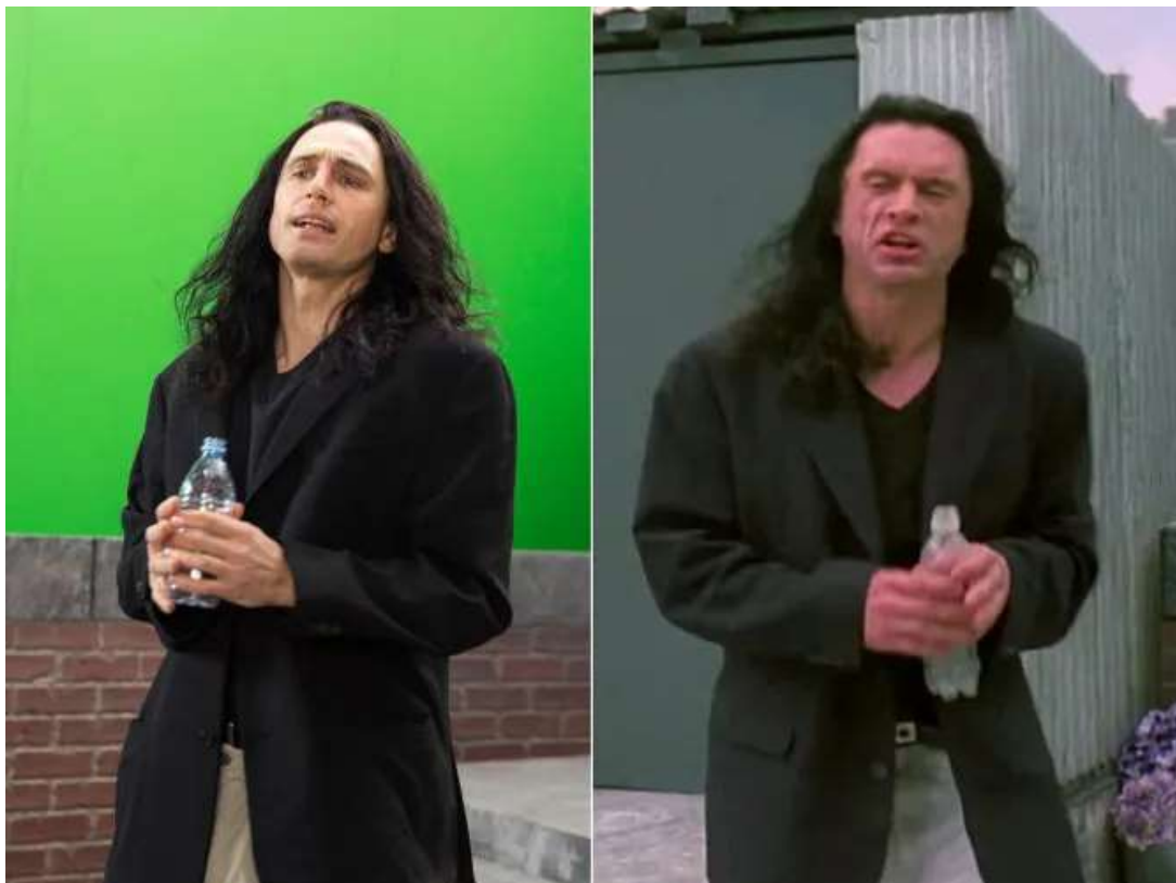
Fig. 3: Den ekstremt arbejdsomme James Franco brød igennem i 1999 i tv-serien Freaks and Geeks og har siden spillet en lang række roller, både i Blockbusters som Spider Man og karakterroller som i The Deuce , der for tiden kan ses på HBO Nordic. I The Disaster Artist er han næsten identisk med Tommy Wiseau.

Dean. I rollen som Wiseau har han fuldstændig tillagt sig dennes karakteristiske manierede kropssprog, snøvlende accent og nærmest Michael Jacksonske excentricitet uden samtidig at falde for fristelsen til at drive fortolkningen ud i lavkomik og ren udhængning. Hvor god efterligningen er, bliver tydeligt, da Francos genindspilninger af ikoniske scener fra The Room vises i splitscreen parallelt med de originale scener i filmens afslutning (fig. 3).