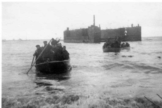
Efter strandingen begyndte man at hente staklerne på den strandede dok

Da 2. verdenskrig nærmede sig sin slutning i Europa, forsøgte tyskerne på alle mulige måder at skjule deres forbrydelser. Indsatte i kz-lejrene blev sendt på de såkaldte dødsmarker, hvor i titusindvis døde eller blev dræbt undervejs.