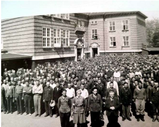
Russerne fotograferet i skolegården

Krigsfangerne var efter befrielsen ikke længere interneret og kunne bevæge sig frit omkring. For russernes vedkommende var det Rudkøbing skole, der – som så mange andre skoler landet over – måtte opleve at blive beslaglagt. Det drejede sig om godt 800 personer.