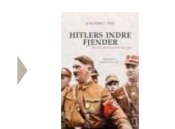
HITLERS INDRE FJENDER

( http://www.historie-online.dk/boger/hitlers-indre-fjender )