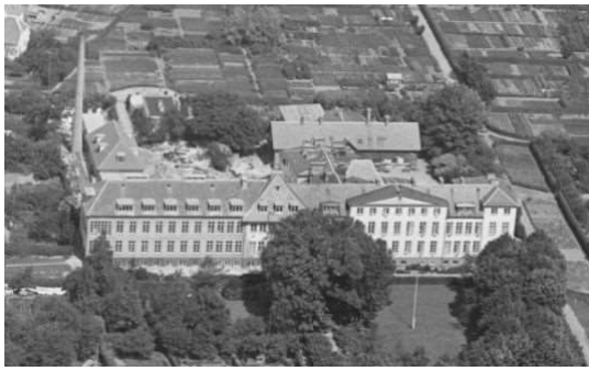
Det gamle sygehus i Rudkøbing

Men sygehuset i Rudkøbing var hårdt trængt. Der havde været mange angreb på tyske skibe med flygtninge. Her havde de sårede fyldt pladserne op, men alt blev gjort for at hjælpe. En af lægerne fortalte, at der i dagene fra den 3. til den 5. maj blev "foretaget henved tredive større operationer på hårdt sårede mennesker..." (s.60). Skæbnen ville også, at den samme unge læge måtte sortere menneskeliv fra. De fik smertestillende medicin og lagt til at dø.