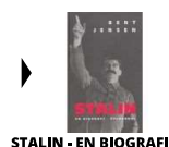
STALIN - EN BIOGRAFI

( https://www.historie-online.dk/boger/anmeldelser-5-5/biografier-erindringer-60-60/stalin-en-biografi )