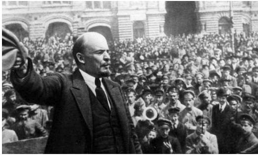
Folkeforføreren Lenin – ikke fra bogen

Desværre er der et ganske stort problem med de sidstnævnte. Nu har jeg også den svenske udgave, der udkom i sommer. Her er billedkvaliteten meget højere trods det, at begge forlag har benyttet sig af FSC miljørigtigt papir. Det er ærgerligt, for der går rent faktisk en del detaljer tabt.