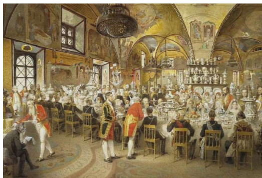
Middag i Vinterpaladset 1873 af den ungarske maler Mihály Zichy

"Der blev serveret middag for næsten tre tusind mennesker. Virkningen af dette skue af så mange mennesker, der sad ned på samme tid, er vanskelig at beskrive. Den størrelsesorden, det hele foregik i, kan kun vurderes, når jeg minder dig om, at der var omkring to tusind tjenere i alt til at servere for gæsterne, deriblandt kosakker, mamelukker (navn for slaver blandt andet fra Kaukasus) og lakajer som dem, vi kender fra det attende århundredes England med kæmpe strudsefjershatte på hovedet. I hvert rum står opstillet et regimentsorkester, der kan spille nationalsangen, hver gang tsaren kommer og går... Der var en anden æresvagt, hvis opgave øjensynligt var at stå ret med løftet sværd fem timer i træk...". (s.16).