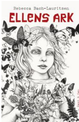
(/boeger/ellens-ark) ELLENS ARK (/BOEGER/ELLENS-ARK) Af Rebecca Bach-Lauritsen