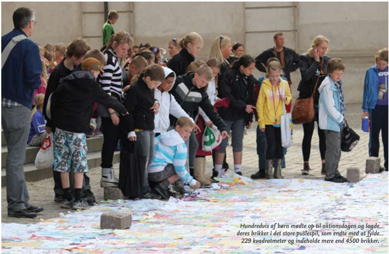
Hundredvis af børn mødte op til aktionsdagen og lagde deres brikker i det store puslespil, som endte med at fylde 229 kvadratmeter og indeholde mere end 4500 brikker.