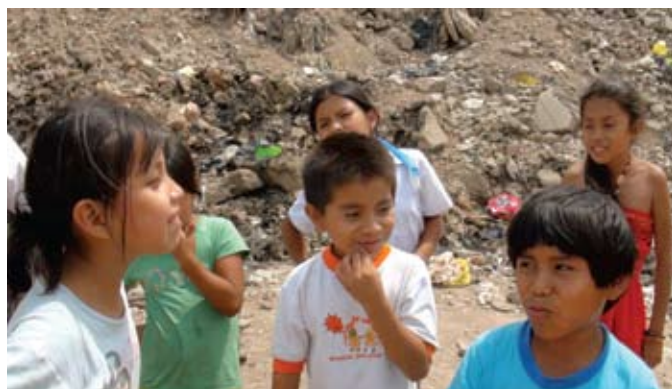
Tema - Når vi siger farvel s.12