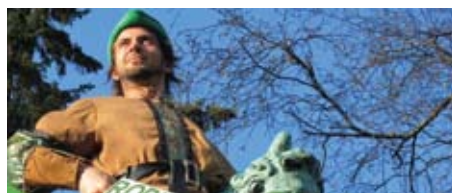
Portræt af en frivillig s. 22