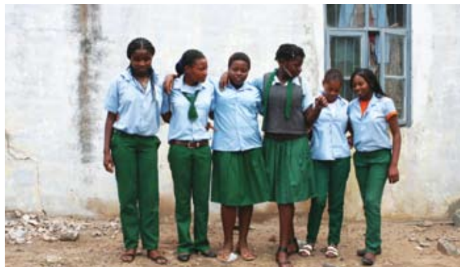
Verden rundt med IBIS s. 4