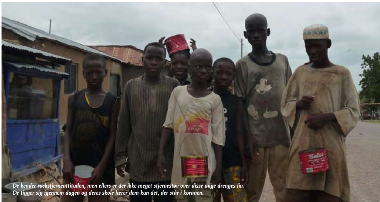
De kender rockstjerneattituden, men ellers er der ikke meget stjernestøv over disse unge drenges liv. De tigger sig igennem dagen og deres skole lærer dem kun det, der står i koranen.