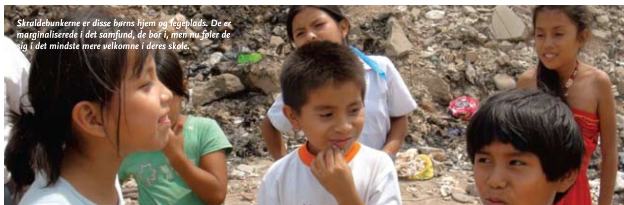
Skraldunkerne er disse børns hjem og legeplads. De er marginaliserede i det samfund, de bor i, men nu føler de sig i det mindste mere velkomne i deres skole.

BRUG DIN SMARTPHONE TIL AT SCANNE KODEN. DU KAN OGSÅ SE BILLESERIERNE PÅ IBIS.DK