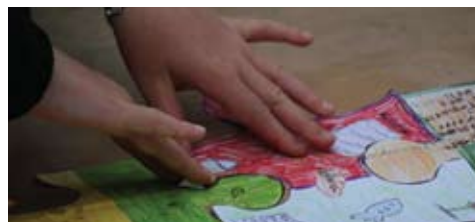
Uddannelse for alle s. 20

REDAKTION Malene Aadal Bo, mab@ibis.dk Annelie Abildgaard (ansv. redaktør), aa@ibis.dk