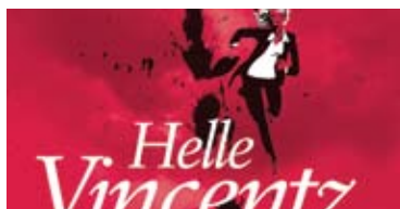
Anmeldelser s. 23