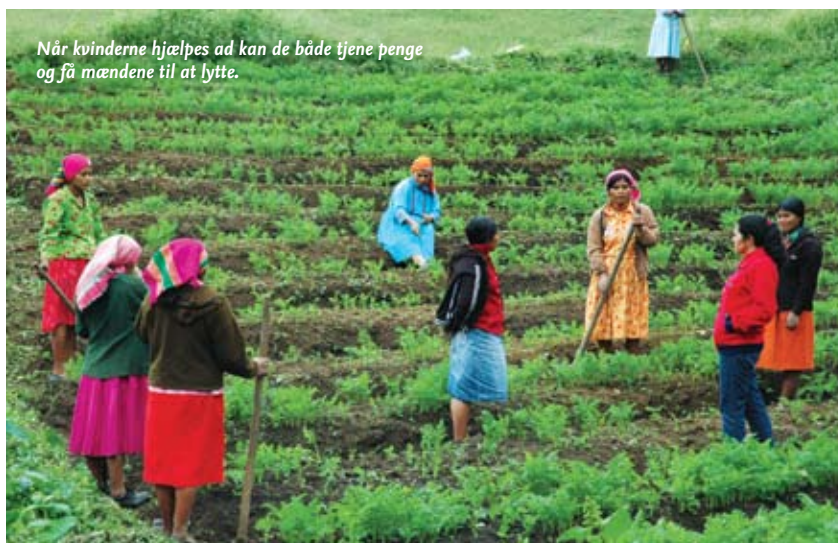
Når kvinderne hjælpes ad kan de både tjene penge og få mændene til at lytte.

BRUG DIN SMARTPHONE TIL AT SCANNE KODEN. DU KAN OGSÅ SE BILLESERIERNE PÅ IBIS.DK