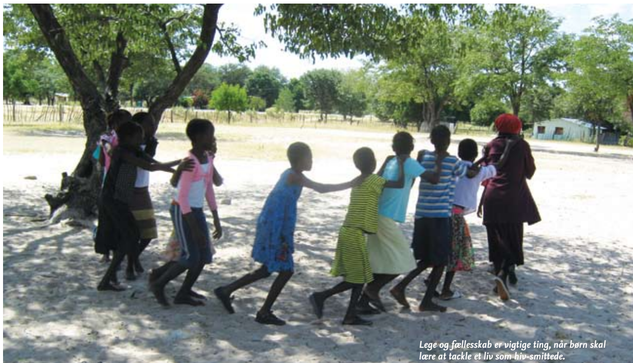
Lege og fællesskab er vigtige ting, når børn skal lære at tackle et liv som hiv-smittede.

I mellemtiden er ligesindede organisationer i andre afrikanske lande blevet interesserede i at anvende inside-out-tilgangen, så Positive Vibes arbejde i dag udbredes til blandt andet Mozambique, Sydafrika, Kenya og Zambia.