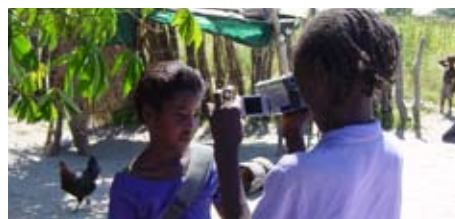
Hvad skete der med Namibia? s. 18