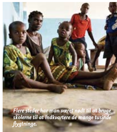
Flere steder har man været nødt til at bruge skolerne til at indkvartere de mange tusinde flygtninge.