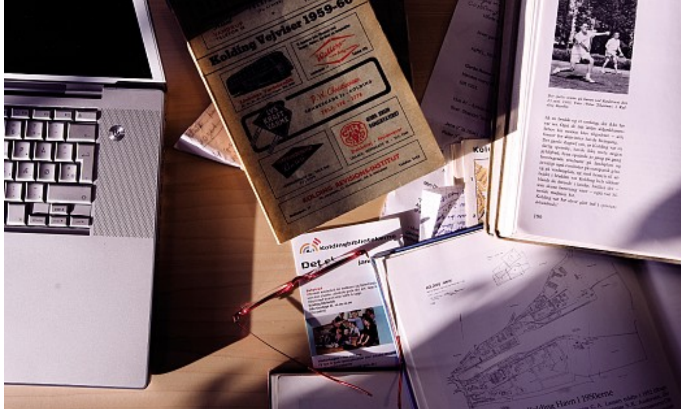
Bibliotekarerne forsyner de elleve forfattere med vejvisere, kortbøger, telefonbøger og aviser. Det lokalhistoriske materiale indgår i de fortællinger, som hver forfatter skriver til Kolding Krøniken.