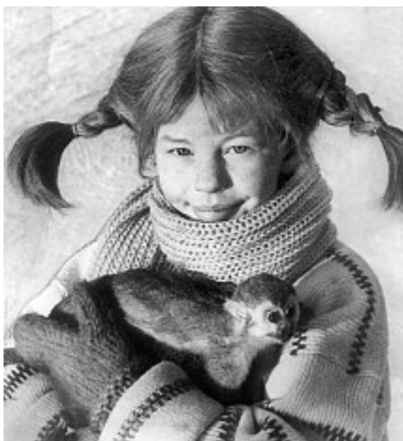
Pippi Langstrømpe er en af Astrid Lindgrens mest elskede figurer, der kendes af store og små børn.