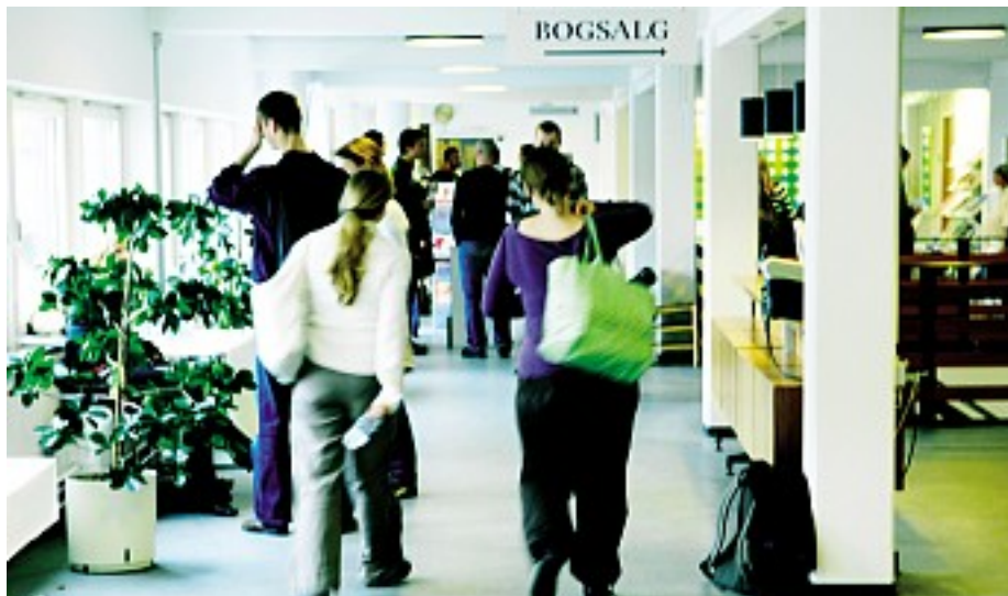
Nu opgraderes biblioteket på biblioteksskolen igen.