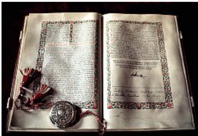
Grundloven fra 1915 ligger sikkert i glasmontrer på Christiansborg. Biblioteksloven fra 2000 er derimod taget ned fra hylden og står måske til ændring.

Siden år 2000 har ordlyden af Biblioteksloven, paragraf 1, været: »folkebibliotekernes formål er at fremme oplysning, uddannelse og kulturel aktivitet ved at stille bøger, tidsskrifter, lydbøger og andre egnede materialer til rådighed, såsom musikbærende materialer og elektroniske informationsressourcer, herunder internet og multimedier.«