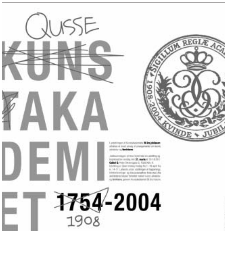
Plakaten til KVINDEJUBIL96UM: Et modificeret rip-off af Kunstakademiets officielle 250 års jubilæumsplakat