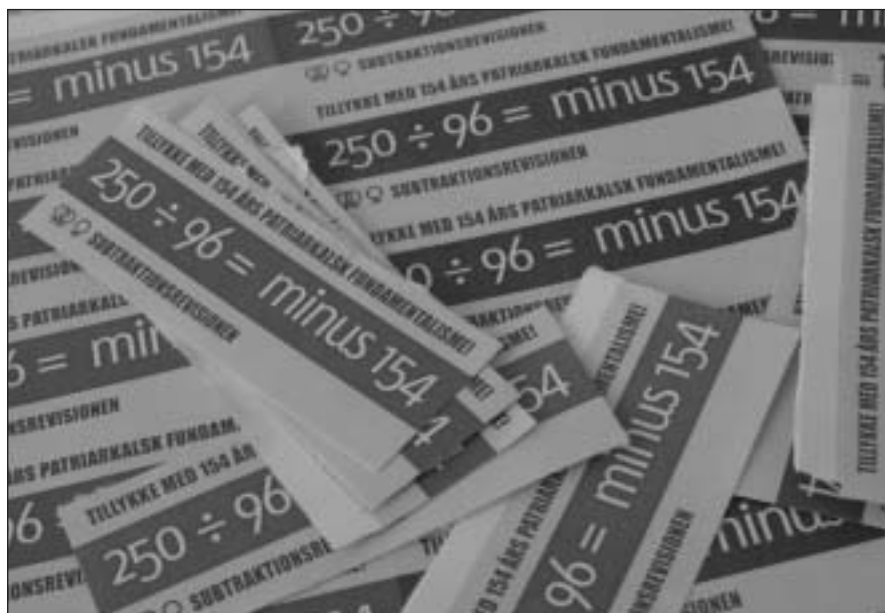
Et Klistermærke. Aktionsgruppen Subtraktion Revisionen lavede en happening under Kunstakademiets officielle jubilæumsfest i Festsalen på Charlottenborg, hvor klistermærker med påskriften 250 \div 96 = -154 blev sat på tøjet af galleriæsterne

arbejdsgang og har taget nye medier i brug. Det har også fornyet debatten om institutionskritikken.