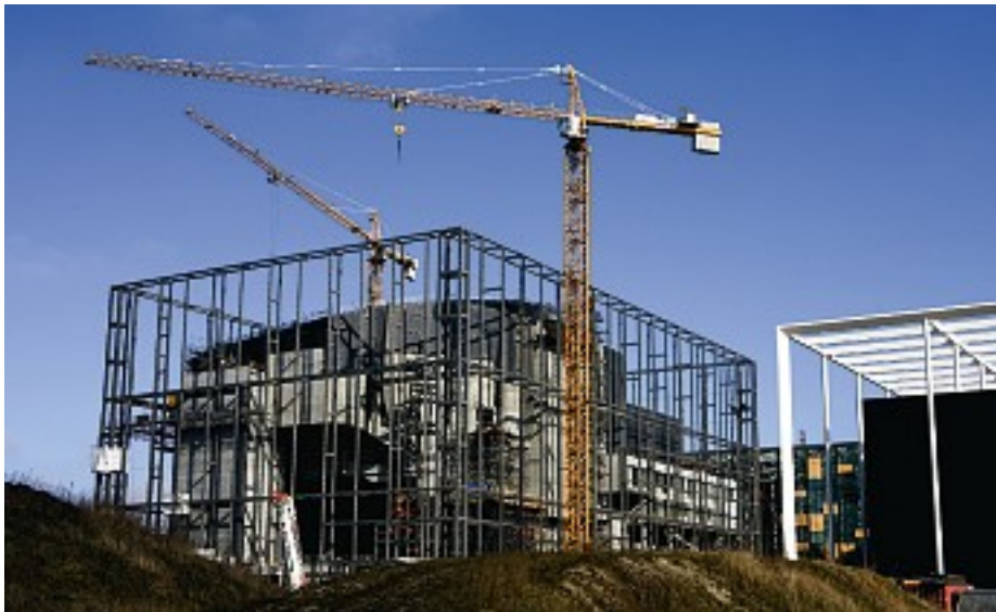
Det dyre DR-byggeri i Ørestaden betyder besparelser overalt i DR. Den 12. september rammer sparekniven DR's arkiv. BF vil være klar med hjælp til de ramte bibliotekarer.