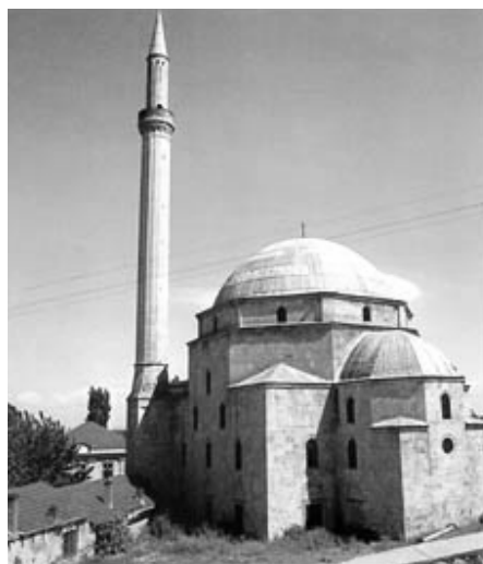
Sinan-Pasha moskeen, Prizren, Kosovo.

Af de øvrige ca. 300 artikler på emperorsclothes kan nævnes A trip to multiethnic Kosovo , der giver førstehåndsskildringer fra Kosovo under UCKs racistiske regimente, hvis "fait accompli" med udvisning af 300.000 racefremmede FN og Vesten helt har accepteret. Mens selv fremstående albanere stadig kan leve helt ubeskyttet i serbiske enklaver, er det ensbetydende med dødsdom at tale serbisk i al-bansk dominerede områder.