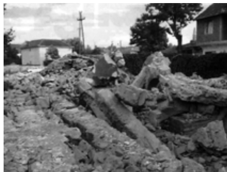
Kirke i Kosovo sprængt i luften af albanerne. Ingen større danske medier har bragt sådanne billeder.

Desuden gennemgås på siden USAs ensidige kampagne for sine protegeeer på Balkan – de bosniske muslimer og de kosovoalbanske separatister. Hvordan amerikanerne fik udskiftet FN-generalsekretær Boutros-Ghali med den følgagtige Kofi Annan, som var rede til at blåstempe enhver aktion mod serberne. Og hvordan Ma-