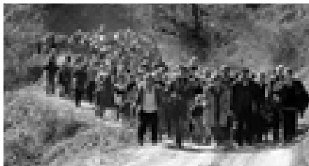
Kosovo-flygtninge på flugt fra NATO's bomber.