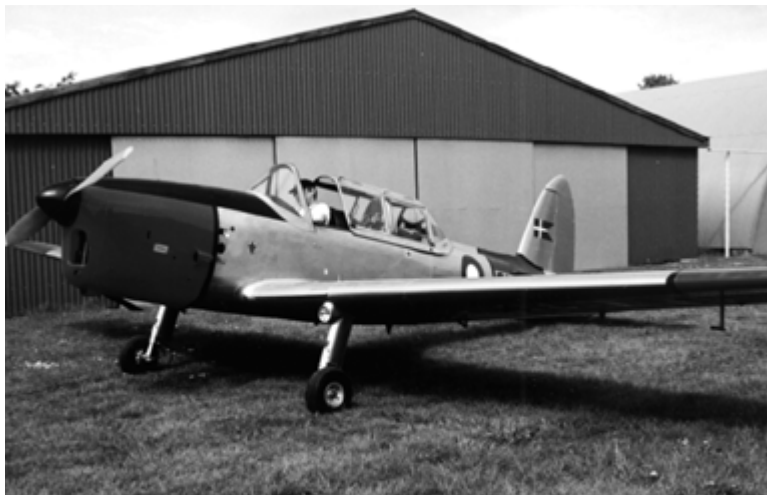
Flyveinstruktøren i sin Chipmunk

”flygtet” fra! Næsten ingen af vore politikere har omverdensforståelse nok til at få et privatflyver-certifikat. For tiden flyver de med fartøjet ”Danmark” uden brændstof, dvs. finansiering, med alt for mange (blinde) passagerer i et globalt politisk stormvejr, og alligevel tvinger de maskinen ”opad” for fuld kraft – mod ”idealet” om det multietniske samfund. Opførte de sig på samme måde i en ”Chipmunk” ville de splitte den ad, propellen ville snurre alene ned i Køge Bugt, og besætningen ville snart være i en om muligt værre tilstand end danske konfirmander efter konfronta-