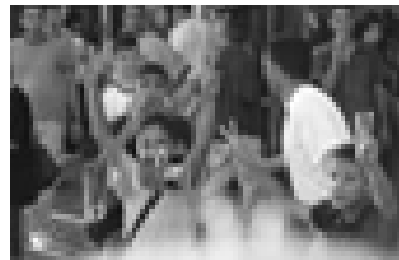
OH Muhamedanere jubler over terroren mod USA

Kun de dumme, de mest uansvarlige og dem, der er mest uvillige til at tænke tingene igennem, kan ikke se.