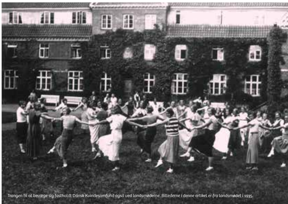
Trangen til at bevæge sig fastholdt Dansk Kvindesamfund også ved landsmøderne. Billederne i denne artikel er fra landsmødet i 1935.