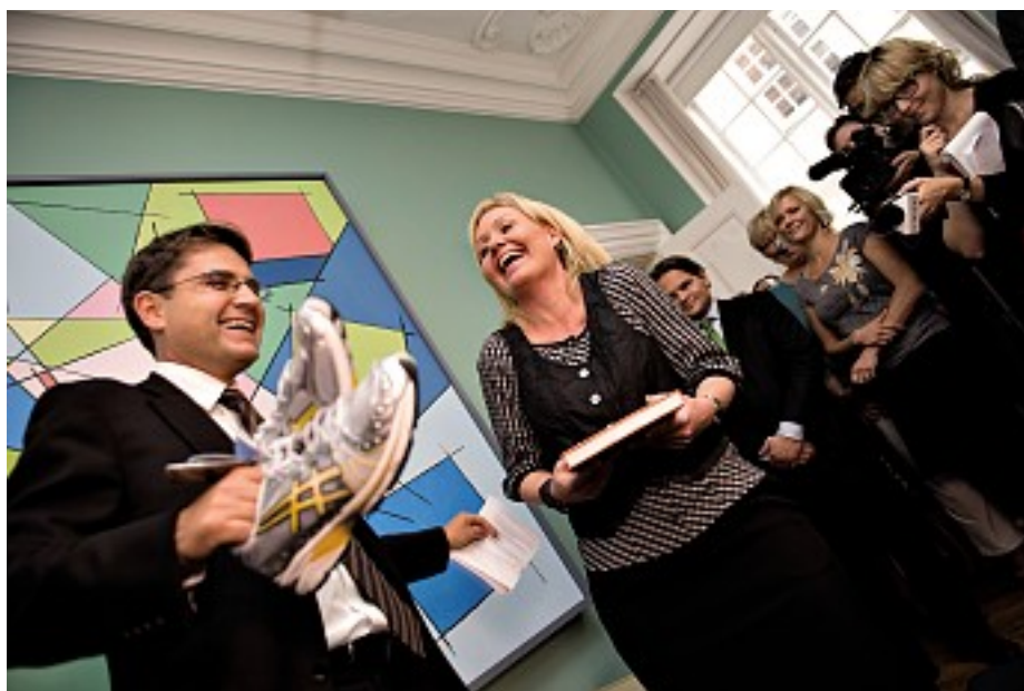
Den afgående og nytiltrådte kulturminister udveksler gaver i kulturministeriet i september 2008.

ne låne dem på biblioteket. Men jeg havde et møde med Danmarks Biblioteksforening i november, hvor vi aftalte, at de skal tage kontakt til musikbranchen. Det ville være fint, hvis de på en eller anden måde ville indgå en frivillig aftale om at afskaffe karenstiden. Som jeg hører det, er musikbranchen mere hooked på det i dag, fordi salgskanalerne nu går andre veje. Danmarks Biblioteksforening vender tilbage til mig efter den indledende dialog, og så må vi se på det derfra, men jeg er helt enig i, at vi skal arbejde for at få lige-stillet medieerne.