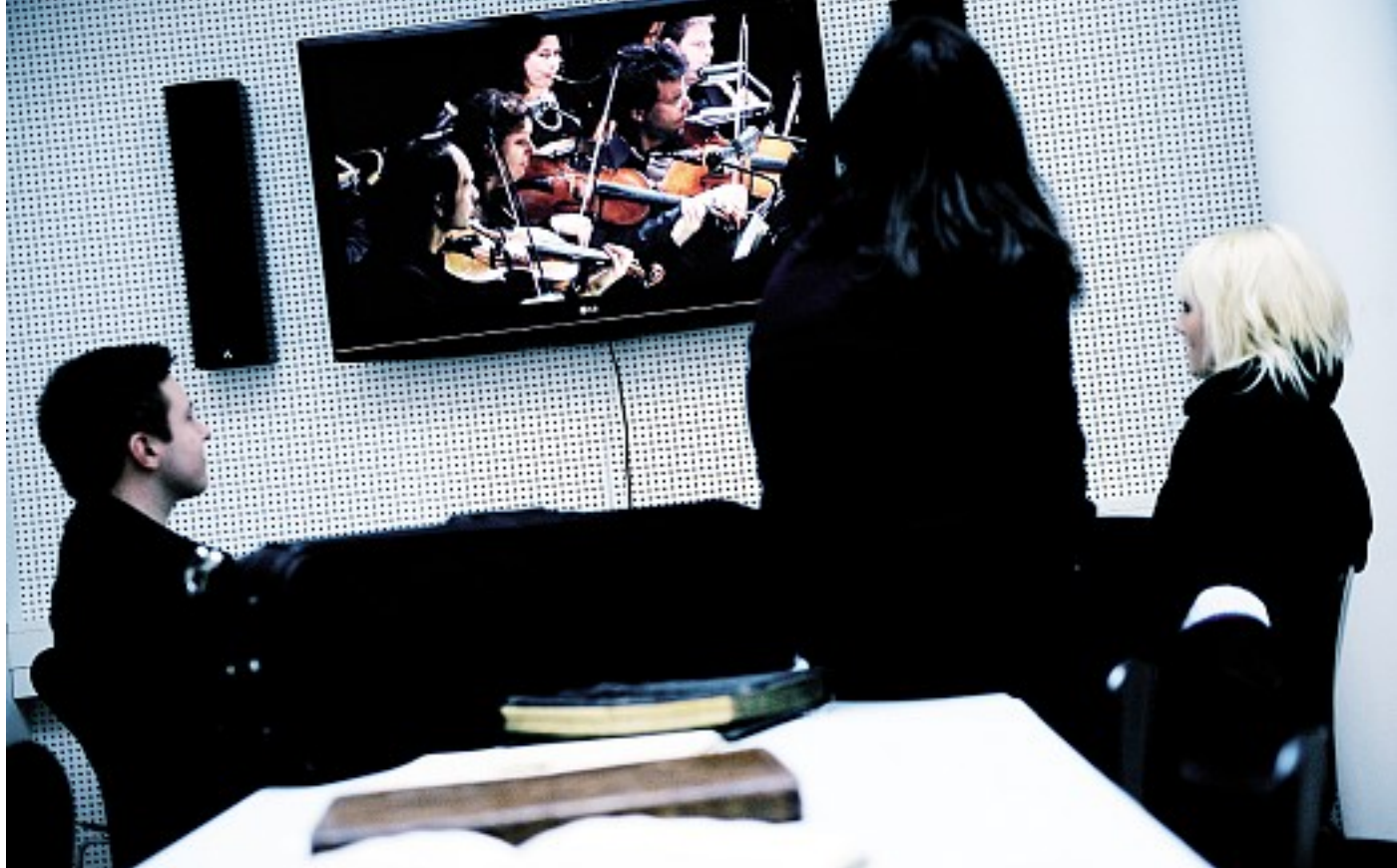
Musikkonservatoriets bibliotek kan nu tilbyde sine brugere et grupperum, hvor de sammen kan høre og se koncerter. Det var en økonomisk håndsækning fra Mærsk MC-Kinney Møller, der gjorde det muligt for biblioteket at indkøbe moderne udstyr i forbindelse med bibliotekets flytning til Radiohusets lokaler.