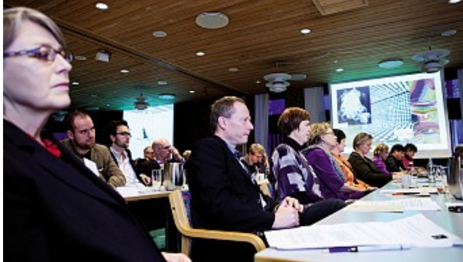
Bibliotekslederne kunne med egne ører glæde sig over kulturministerens løfter om et grundigt udvalgsarbejde.