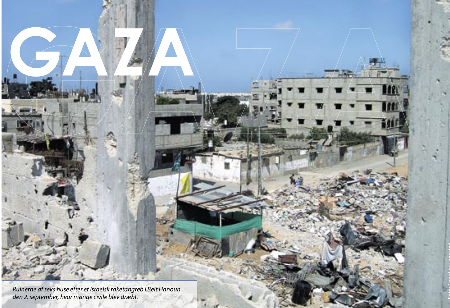
Ruinerne af seks huse efter et israelsk raketangreb i Beit Hanoun den 2. september, hvor mange civile blev dræbt.