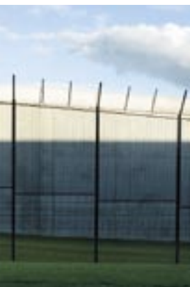
Danmark anvender isolationsfængsling langt mere end andre EU-lande.