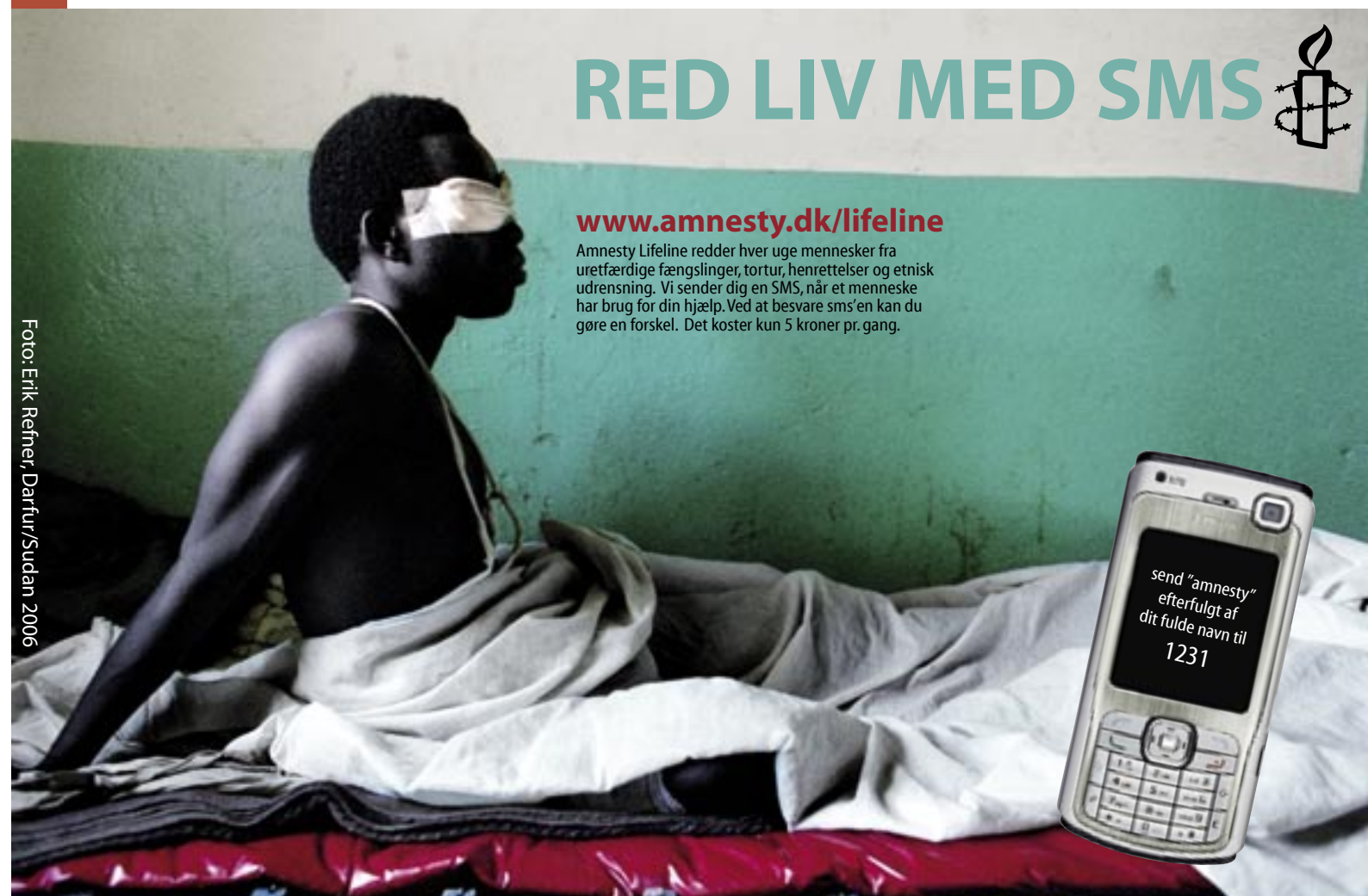
Darfur/Sudan 2006

Amnesty Lifeline redder hver uge mennesker fra uretfærdige fængslinger, tortur, henrettelser og etnisk udrensning. Vi sender dig en SMS, når et menneske har brug for din hjælp. Ved at besvare sms'en kan du gøre en forskel. Det koster kun 5 kroner pr. gang.