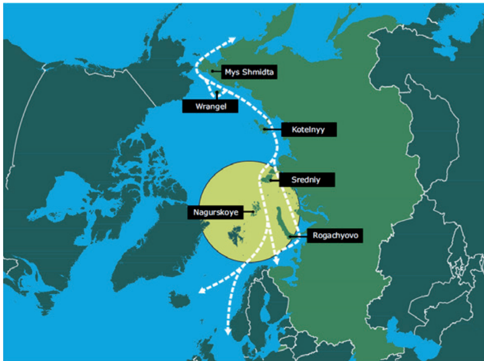
ILL: Kortet viser Rusland seks fremskudte baser

Det russiske forsvar har i de seneste år genopbygget eller nyoprettet en række militære installationer, inklusive luftbaser, langs den russiske nordkyst. De gule cirkler viser jagerflys rækkevidde fra disse baser. Med optankning i luften øges rækkevidden betragteligt, og flyene vil nu på kort tid kunne nå f.eks. den amerikanske Thule-base i Grønland. Hertil kommer den russiske Nordflådes styrker og arsenaler, inklusive nye missilbærende ubåde på flådebaserne på Kolahalvøen. Den russiske genoprustning i Arktis skyldes bl.a. et behov for øget sikkerhed for olie- og gasinstallationer og den tiltagende fragtsejlad i Nordøstpassagen. Passagen ses som hvide striber på kortet.