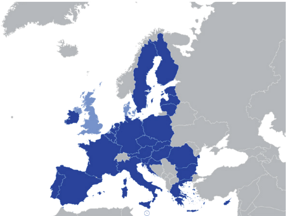
ILL: NordNordWest, https://creativecommons.org/licenses/by-sa/3.0/de/legalcode

Ligeledes har EU-institutionerne været helt klare omkring Unionens mål. Samarbejdet mellem EU og NATO er skredet støt frem, og EU har søgt at løse strategiske bekymringer af fælles interesse for fx både amerikanere og europæere med projekter som militær mobilitet. I forlængelse af EU's globale strategi har både Rådet og Euro-