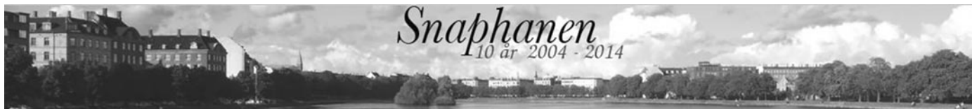
Bloggen Snaphanens coverbillede.

Steen Raaschou er under anklage for at have bragt sandheden om mord, som alle medier løj om. Vi forsøger at indkredse, hvem "forbryderen" i virkeligheden er.