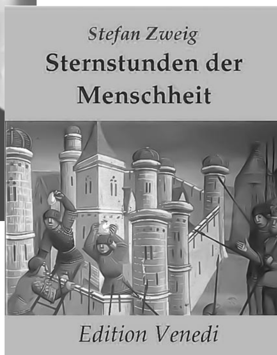
Sternstunden der Menschheit 1927.