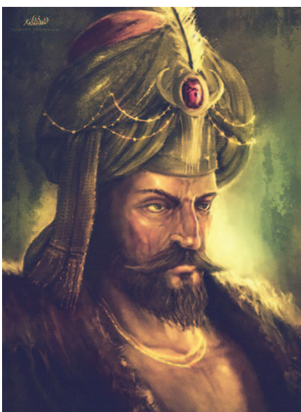
Sultan Mehmed 2.

"Erobringen af Istanbul (Konstantinopel) og omdannelsen af Hagia Sophia til en moske er blandt de mest glørværdige kapitler i tyrkisk historie.... Genindvielsen af Hagia Sophia repræsenterer vores historiske hukkommelse fuld af storhed, fra slagene om Badr til Manzikert, fra Nicopolis, til Gallipoli (alle hellig krig sejre)... Genindvielsen af Hagia Sophia kræves af vores respekt og engagement over for alle vores forfædre, fra Alp Arslan (islamisk sejrherre ved Manzikert og erobreren af Lilleasien, som gjorde titusinder af kristne til slaver) til Mehmet al-Fatah