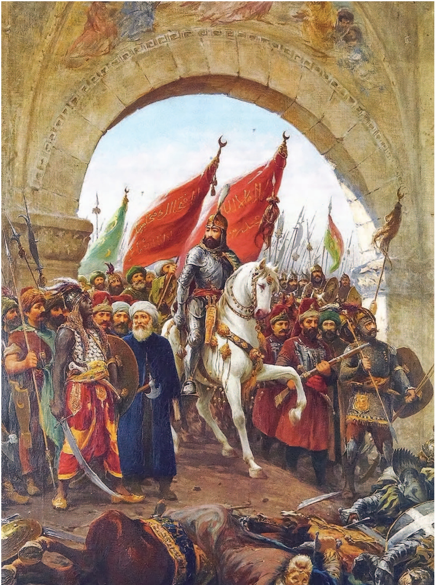
Mehmed 2 rider ind i Konstantinopel.