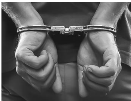
“så bliver jeg lagt i håndjern og kørt på Bellahøj”.

Og så bliver jeg lagt i håndjern og kørt på Bellahøj, hvor jeg sidder en time i en celle og glor. Så afhører de mig og tager dna og fingeraftryk.