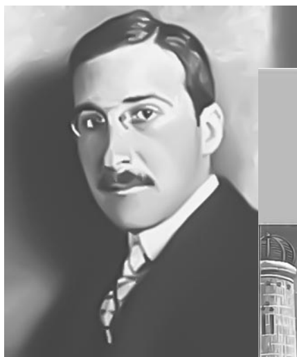
Stefan Zweig 1881-1942.

Stefan Zweigs fortælling er en af i alt tolv beretninger om vigtige øjeblikke i menneskehedens historie udgivet i samlingen "Sternstunden der Menschheit" fra 1927. Den er udgivet flere gange på dansk med titlen "Stjernestunder".