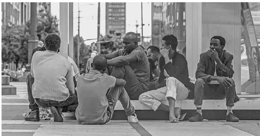
Afrikanske mænd i Milano.

På Lampedusa opfører mange af de unge tunesere sig afskyeligt. En kvinde klager over, at de har opført sig uterligt mod hendes datter og spist hendes hunde. For nogle år siden skete noget lignende i Rom, hvor de herreløse katte blev spist af illegale