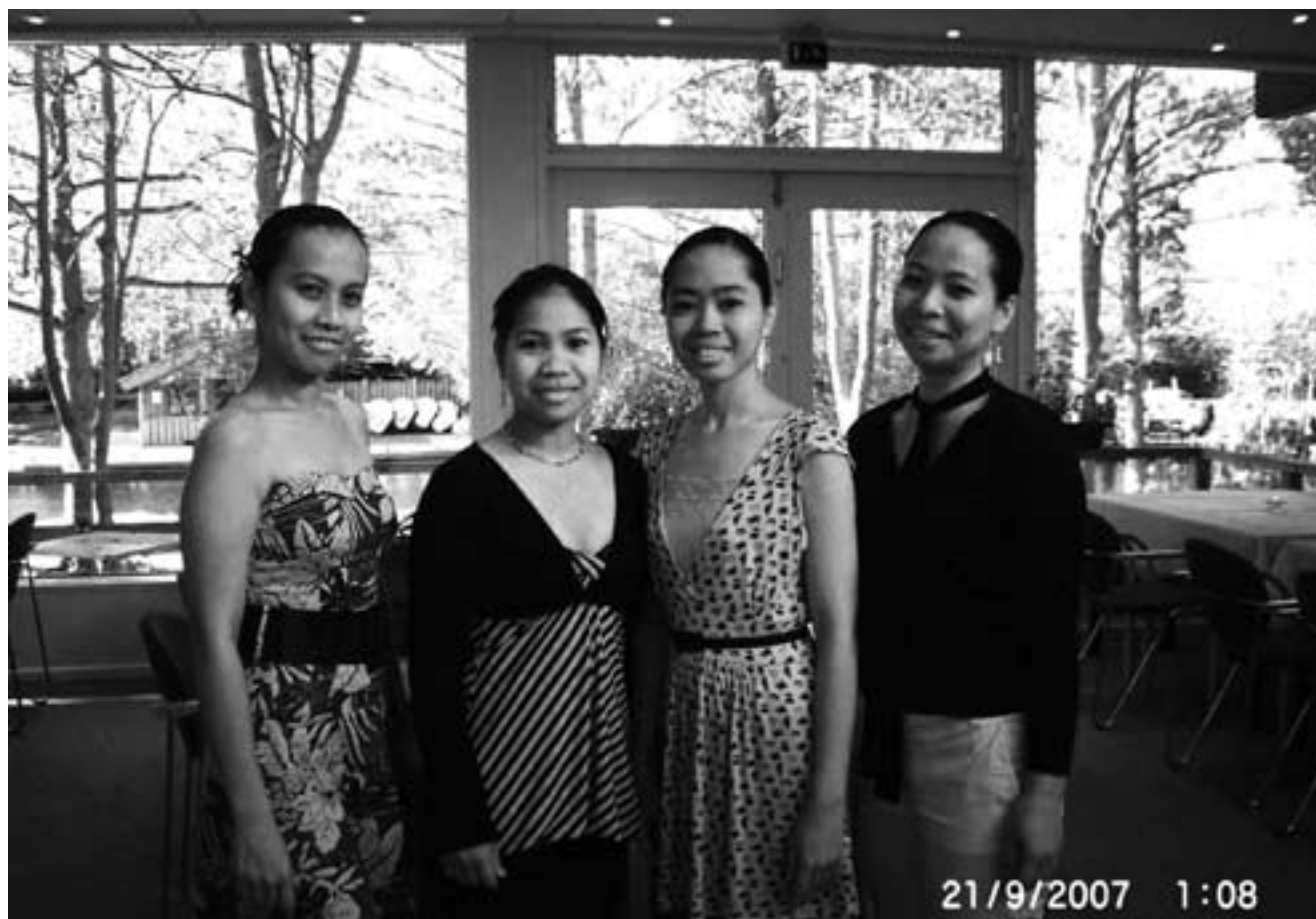
Når de filippinske au pairs i Danmark holder fri, mødes de ofte med hinanden, fx i den lokale katolske kirke. Her er nogle af dem på en fridag.

udlandet for at arbejde, og samlet sender de tæt på 20 milliarder dollar hjem. De arbejder i forskellige fag: som IT folk, læger, sygeplejersker,