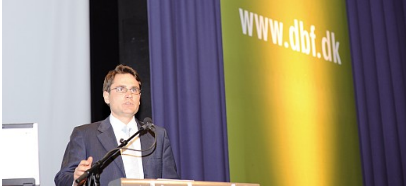
Kulturministeren havde pegefingern fremme på Danmarks Biblioteksforenings årsmøde. Han holder øje med bibliotekernes bogindkøb.