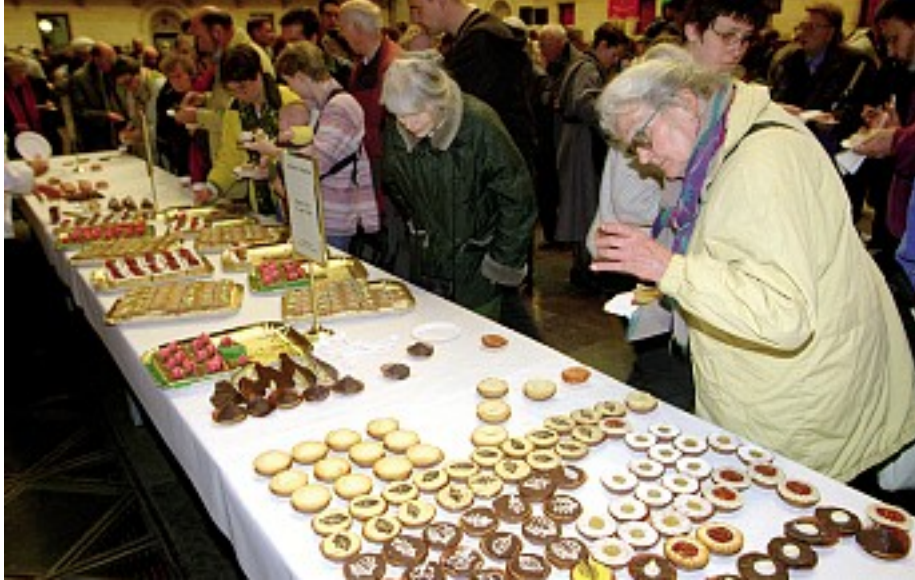
De garvede bibliotekarer har fået ekstra råd til selvforsyning med Ny Løn.