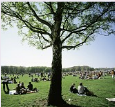
1. maj bliver fremover en fridag fra klokken 12 på det kommunale område.