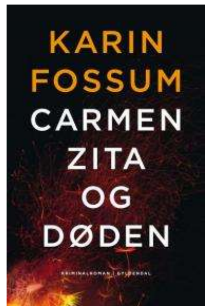
(/boeger/carmen-zita-og-doden) CARMEN ZITA OG DØDEN (/BOEGER/CARMEN-ZITA-OG-DODEN) Af Karin Fossum