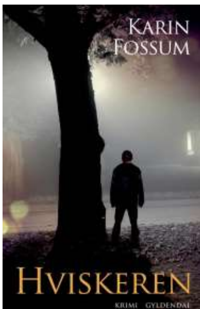
(/boeger/hviskeren-0) HVISKEREN (/BOEGER/HVISKEREN-0) Af Karin Fossum